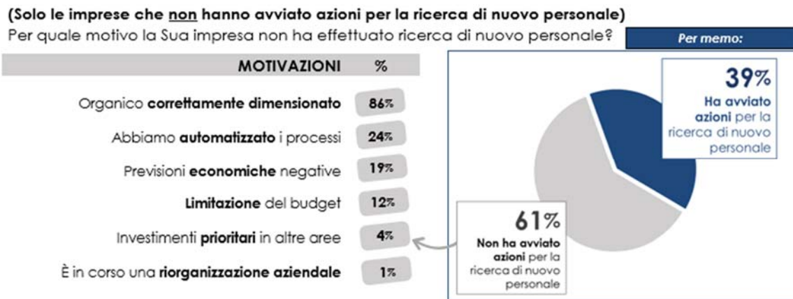
Fig 4. Mancata ricerca del personale

Le società di ricerca del personale sono il canale principale per il reclutamento, preferite dal 78% delle imprese. I siti aziendali seguono con il 33%, mentre agenzie pubbliche e portali di lavoro rimangono meno utilizzati, evidenziando una predilezione per i canali tradizionali